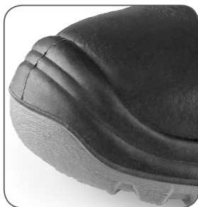
zesílená přední část proti okopu reinforced PU overcap przednia część wzmocniona PU